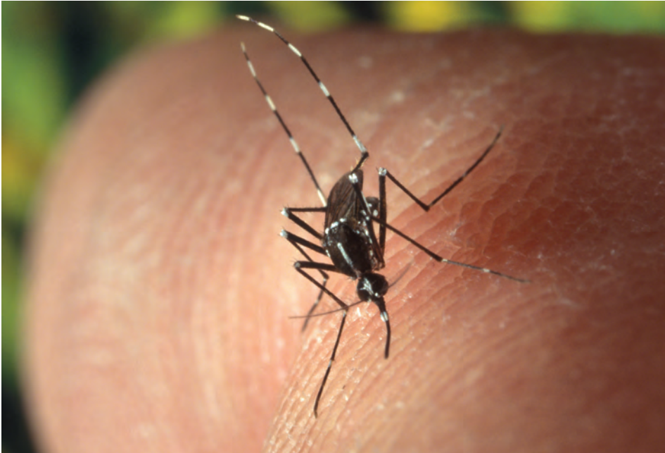
Abb. 1: Weibliche Tigermücke ( Ae. albopictus ), erkennbar an dem weißen Streifen am Thorax, den gestreiften Tarsen (wobei Tarsus 5 ganz weiß ist) an den Hinterbeinen, und den Palpen mit den weißen Spitzen. Des Weiteren ist die Färbung des Abdomens von Bedeutung, hier sind die Tergite schwarz, mit basal gelegenen dünnen weißen Streifen, sowie weißen lateralen Flecken.

Arten, welche sich zunehmend in Europa ausbreiten und aufgrund ihre human- und veterinärmedizinischer Relevanz von öffentlichem Interesse sind, wären die Asiatische Buschmücke ( Aedes japonicus ), die Asiatische Tigermücke ( Ae. albopictus ) und die koreanische Buschmücke ( Ae. koreicus ).