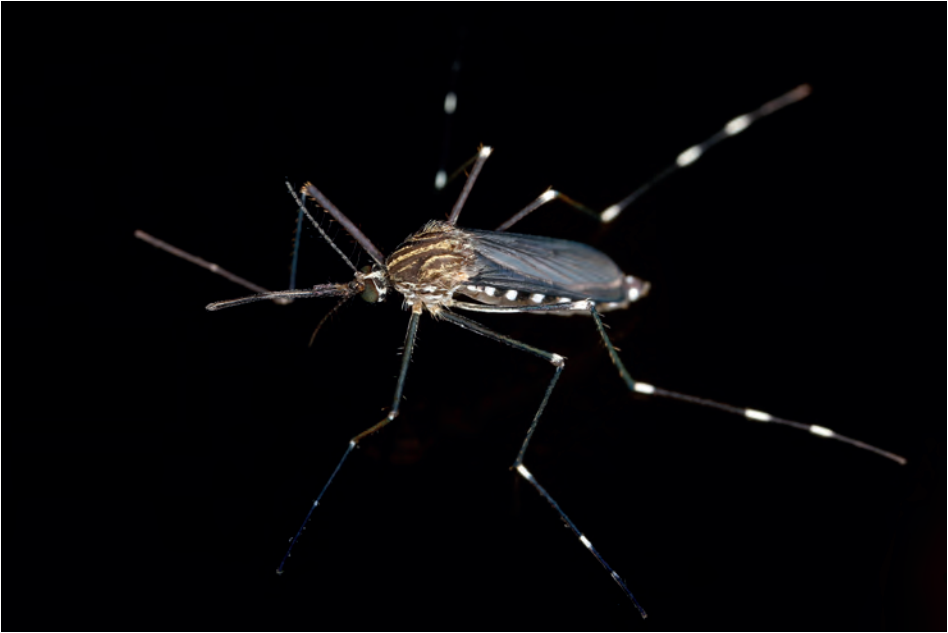
Abb. 2: Weibliche Japanische Buschmücke ( Ae. japonicus ), erkennbar an dem Muster aus goldenen Streifen am Thorax, den gestreiften Tarsen, und den einheitlich dunklen Palpen. Des weiteren ist die Färbung des Abdomens von Bedeutung, hier sind die Tergite schwarz, mit weißen lateralen Flecken. Die Koreanische Buschmücke ( Ae. koreicus ) sieht sehr ähnlich aus, sie unterscheidet sich jedoch in der Färbung von Tarsomer 5 der Hinterbeine: Bei Ae. japonicus sind diese einheitlich dunkel, bei Ae. koreicus schwarz und weiß.

der Umstand sein, dass die Asiatische Tigermücke aus tropischen Gebieten stammt und ihre nördliche Ausbreitungsgrenze in Europa vor allem durch die vorherrschenden Wintertemperaturen und die jährliche Jahresmitteltemperatur bestimmt wird (CUNZE et al. 2016, ROIZ et al. 2011). Steigende Temperaturen im Zuge der Klimaerwärmung begünstigen somit die Etablierung von Populationen der Asiatischen Tigermücke in immer nördlicheren Gebieten (KRAEMER et al. 2019). Im Jahre 2020 wurden im Rahmen eines Stechmücken-Monitorings erste Hinweise auf eine bevorstehende Etablierung dieser Art in Tirol gefunden werden (FUEHRER et al. 2020). Die Asiatische Tigermücke wäre die erste Stechmückenart in Österreich, die auch tropische Viren wie Chikungunya, Dengue und Zika in Österreich übertragen könnte (BONIZZONI et al. 2013, GRATZ 2004, MEDLOCK et al. 2012). Bisher gibt es keine Hinweise, dass einheimische Stechmücken dazu in der Lage wären.